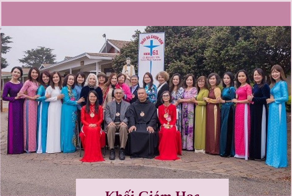
Khối Giám Học