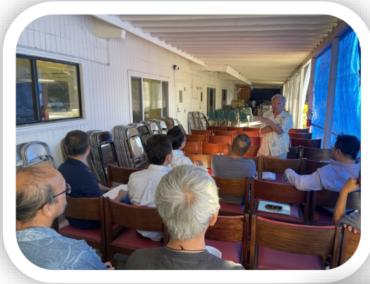
KHỐI GIÁM HỌC NAM