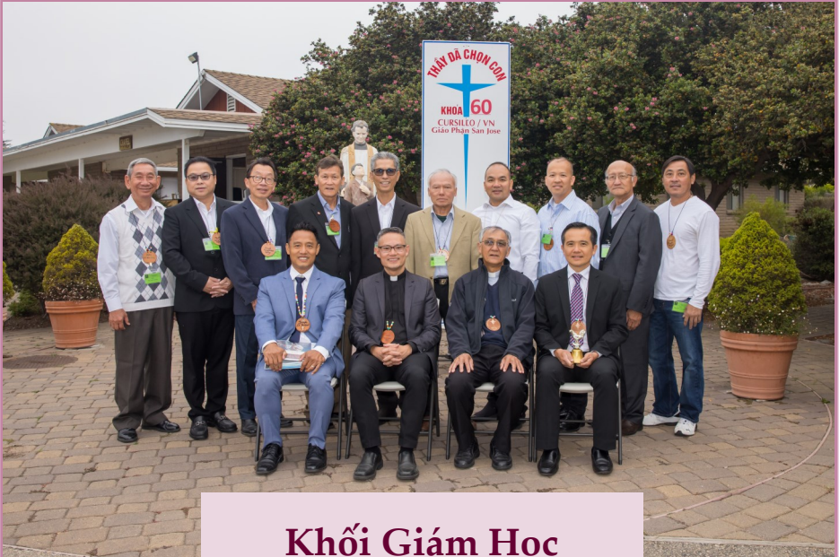
Khối Giám Học