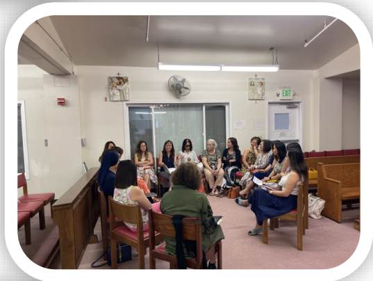
KHỐI GIÁM HỌC NỮ