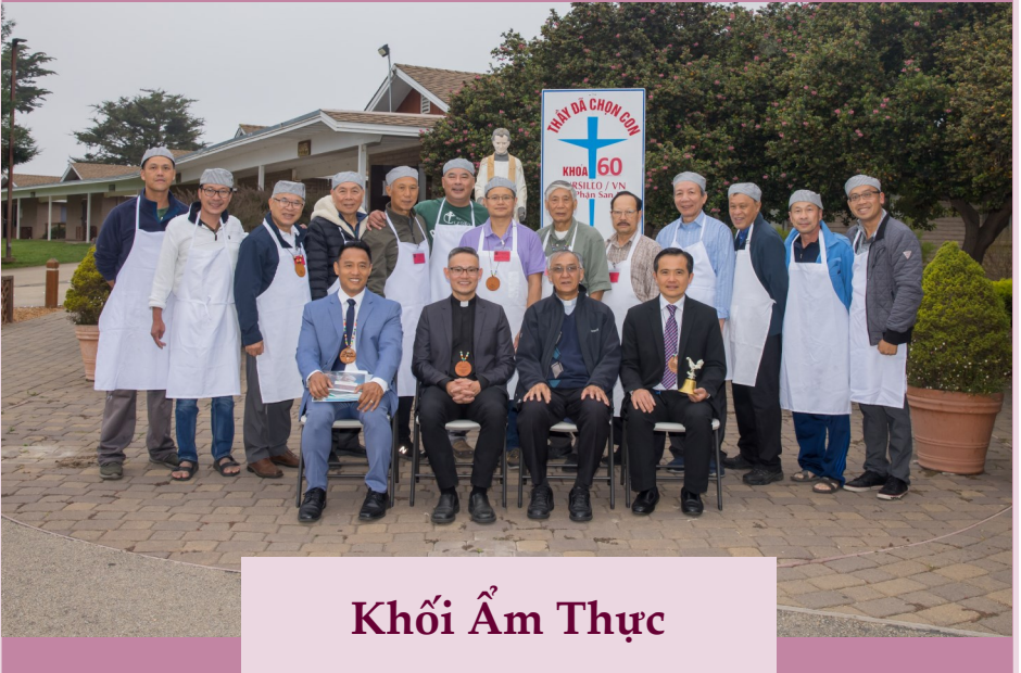
Khối Âm Thực