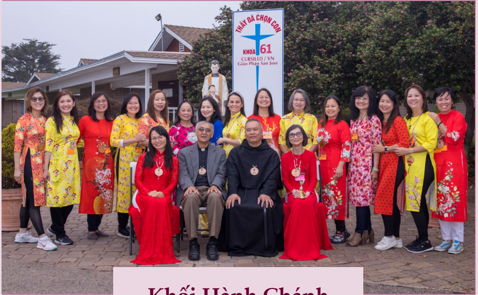
Khối Hành Chánh