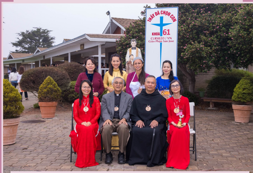
Ban Điều Hành Khóa 61