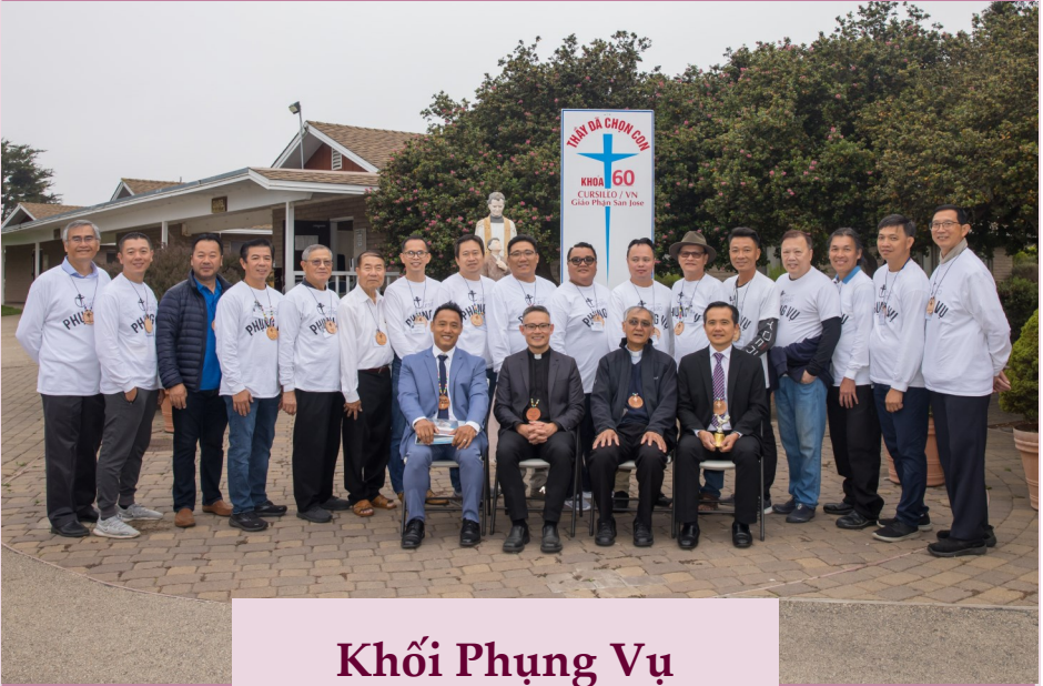
Khối Phục Vụ