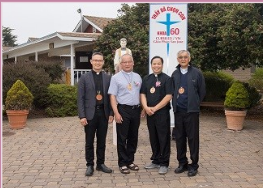
Quý Cha Linh Hưởng & Khóa Sinh