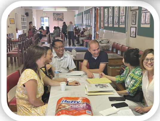
KHỐI HÀNH CHÁNH NAM & NỮ