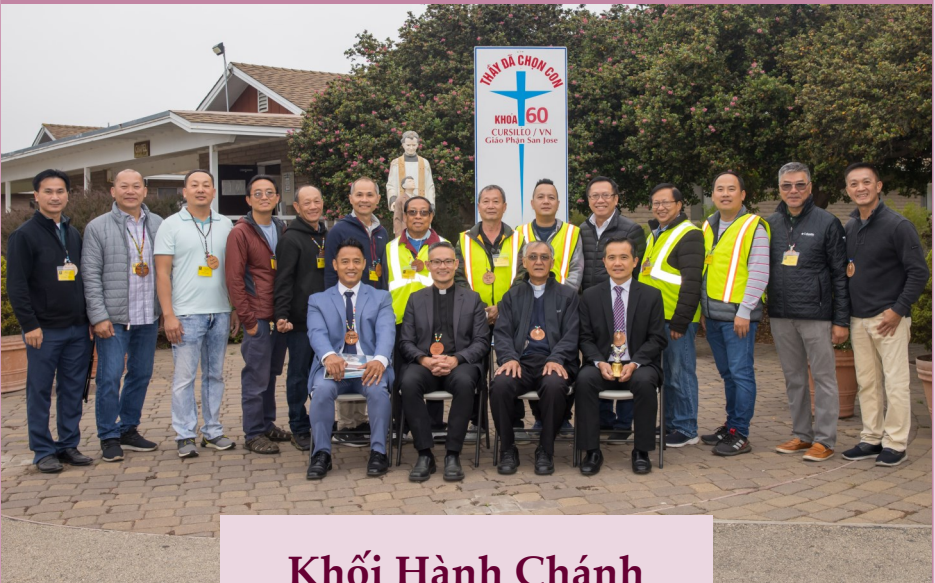
Khối Hành Chánh