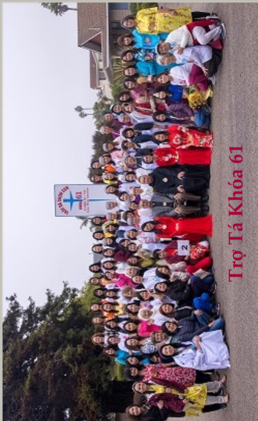
Trợ Tá Khóa 61